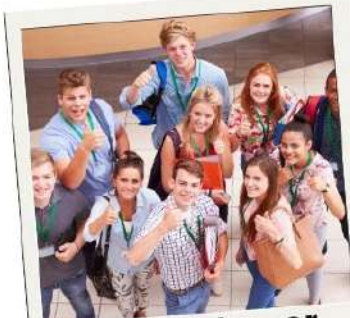
Podrás hacer nuevos amigos...