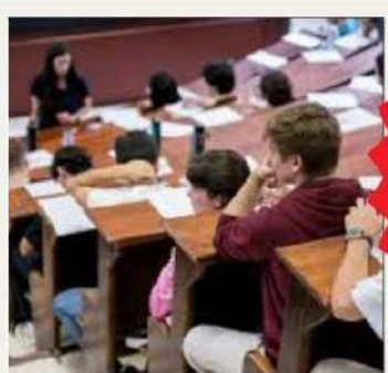
Materia presente en las pruebas de acceso a la universidad

Posibilidad de intercambio- movilidad de larga duración con el instituto francés con Évreux y Nancy en 4º de la ESO y 1º de Bachillerato