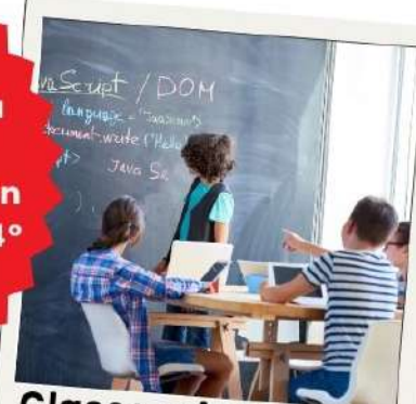
Clases orientadas al uso de la lengua y a la participación de los alumnos

Posibilidad de intercambio- movilidad de larga duración con el instituto francés con Évreux y Nancy en 4º de la ESO y 1º de Bachillerato