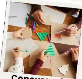
Concurso de postales navideñas